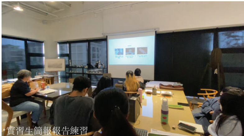
*實習生簡報報告練習