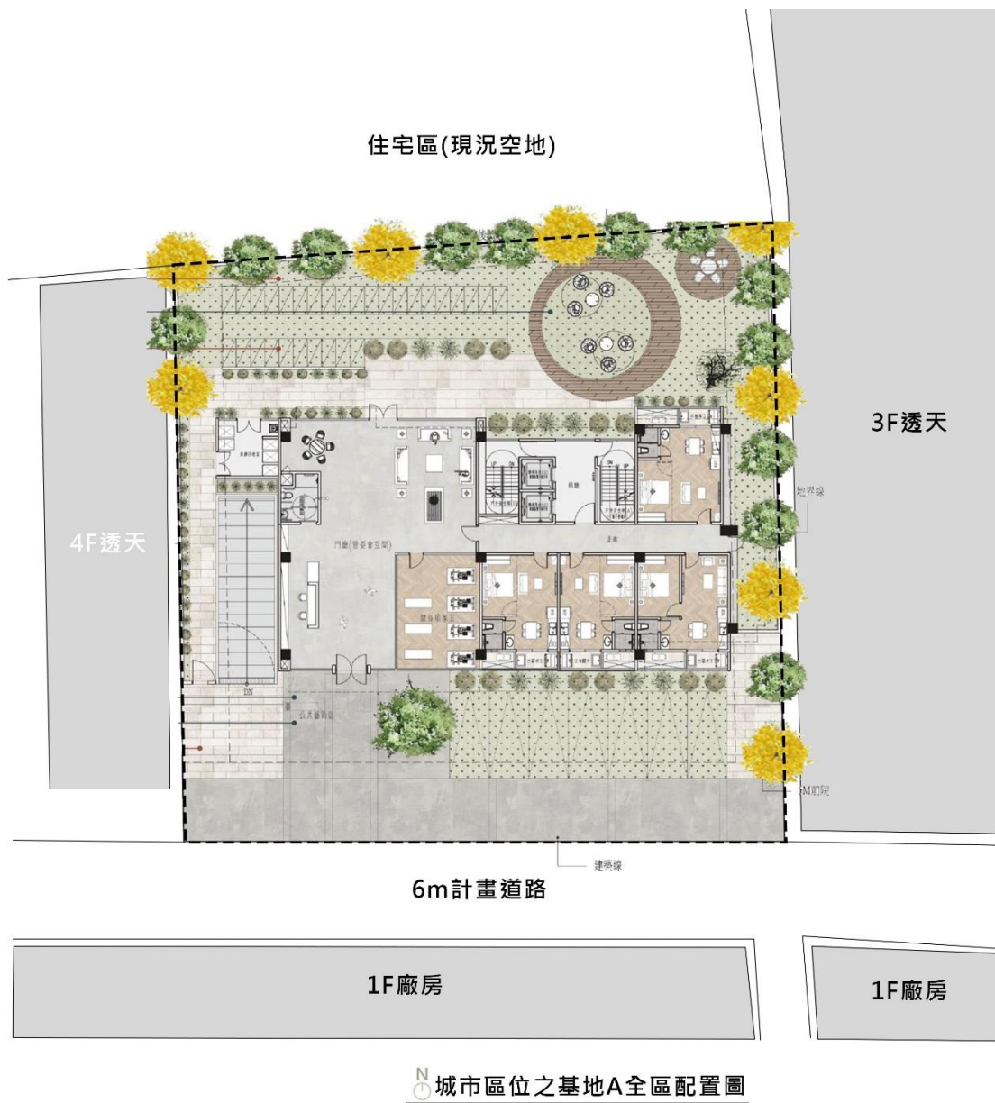
圖 1：基地 A 平面配置圖